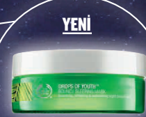
YENİ DROPS OF YOUTH™ BOUNCY SLEEPING MASK