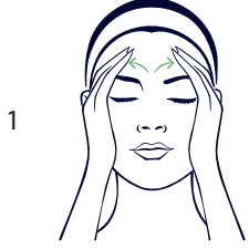
1 Gökkuşağının üzerinde

Doktor Terry akılda kalacak cümlelerle uygulaması kolay masaj teknikleri hazırladı. Bu masaj tekniğini, lenf sistemini canlandırmak, dolaşımı hızlandırmak ve maskenin daha kolay nüfuz etmesini sağlamak için, maskeyi uygularken iki defa yapın.