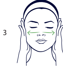
3 Dünyanın etrafında