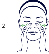
2 Bulutların altında