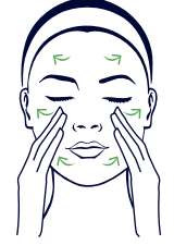
5 Patir patir